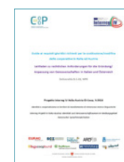
Guida ai requisiti giuridici richiesti per la costituzione/modifica delle cooperative / Leit- faden zu rechtlichen Anforderungen für die Gründung/Anpassung von Genossenschaften D.5.01