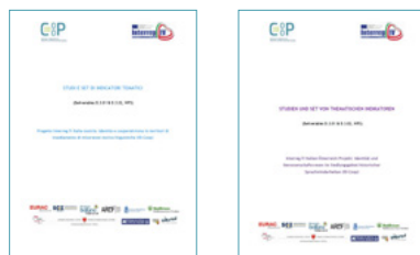
Studi e Set Indicatori Tematici / Studien und Set Thematischen Indikatoren D.3.01 & D.3.02