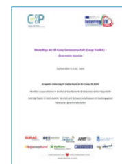
Modello-tipo di cooperativa ID-Coop / Modelltyp der ID-Coop Genossenschaft D.4.02