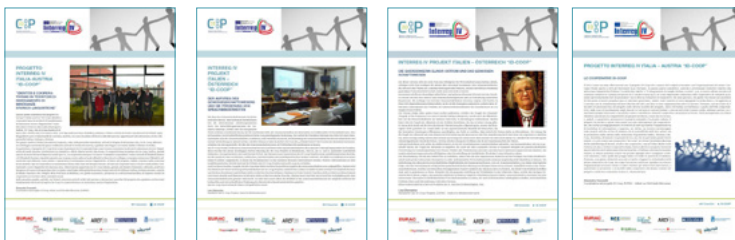
Newsletter (I, II, III, IV) D.2.05