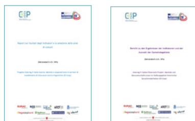
Report Risultati Indicatori & Selezione Aree Comuni / Bericht Ergebnisse, Indikatoren & Auswahl der Gemeindegebiete D.4.01